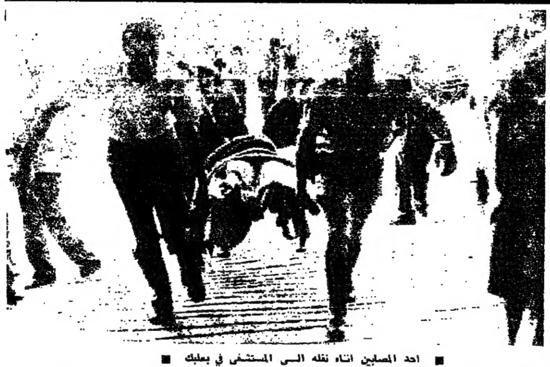
أحد المصلين أثناء نقله إلى المستشفى في بعلبك

بعلبك - من مراسل «الأور»: لكرت مصادر قضائية إسرائيلية ١٥ شخصاً قتلوا، وأصيب أكثر من ٥٠ شخصاً بجروح، في حادث انفجار مؤسف وقع أمس في «وادي بعلبك» بجوار بعلبك. وقالت مصادر أخرى أن عدد القتلى ارتفع خلال الليل إلى ٢٦، وأن هناك عدداً آخر من الجرحى بحالة الخطر. ولكرت مصادر قوى الأمن أن عدداً كبيراً من المصلين كانوا يتدبرون على زرع الآفام، عندما انفجر لغم كبير أدى إلى وقوع هذا الحادث المروع. وقد نقل الجرحى إلى مستشفيات بعلبك وزحلة وبيروت، فيما نقل جرحاين إلى سوريا. وبنات الإهالي في بعلبك وزحلة على المستشفيات للترميم بالمدم، فيما انتقلت بعض طيبة من بيروت إلى بعلبك للمساعدة في إسعاف المصلين. وعقد في مركز محافظة البقاع اجتماع ضم محافظ البقاع والوكيلة السيد بنو عاتوني، وأمر سرية درك زحلة القديم جورج أبو شرا وعدها من المسؤولين، جرى خلاله البحث في الحادث وملازمته، وانضمت تدابير سرية فنانين كل ما يلزم لإسعاد المصلين، وهو الأمر الذي أعطى الأولوية في الاهتمام. وقد جرى مطران زحلة للروم الكاثوليك بوحنا بسول اتصالاً بشيخ بعلبك وأبلغهم استعداد شهاب زحلة للترميم بالمدم، وبالمثل قررت جرحاين الكاثوليك وديي الزخيليون إلى التبرع بالمدم.